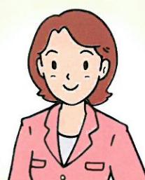
主任ケアマネジャー